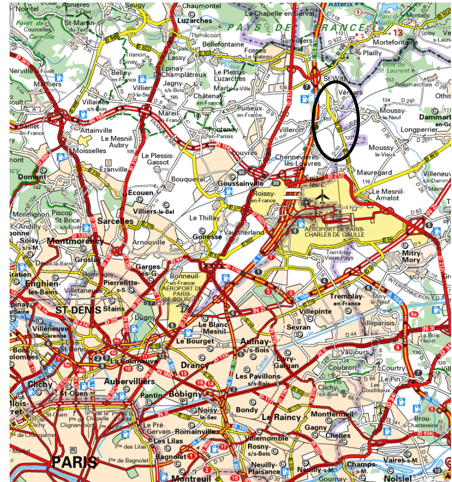
Situation de Vémars