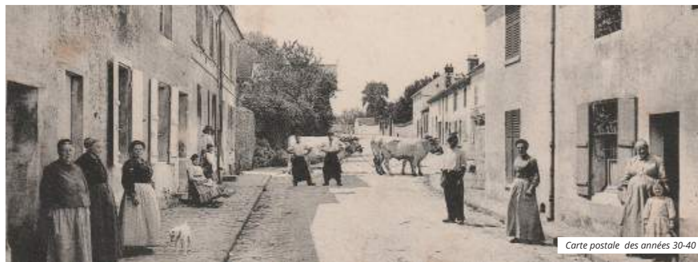
Carte postale des années 30-40

- à gauche, un des nombreux cafés de l'époque de Vémars, toujours très fréquenté car un des seuls lieux de distraction en ces temps-là.