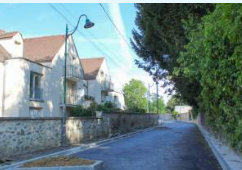
Rue de la mairie : réfection de la voirie

Retour en images sur les travaux qui ont eu lieu en 2023 à Vémars.