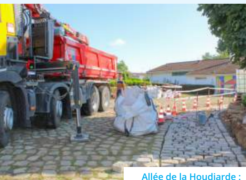
Allée de la Houdiarde : création d'un parking