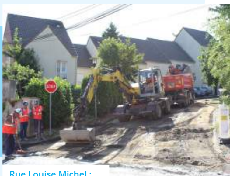
Rue Louise Michel : réfection de la voirie