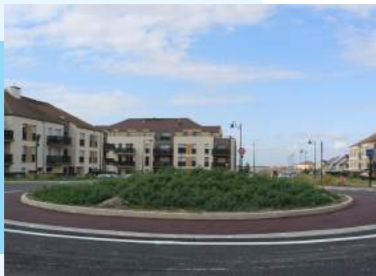
Hauts de Vémars (RD9) : création d'un rond-point par le Département